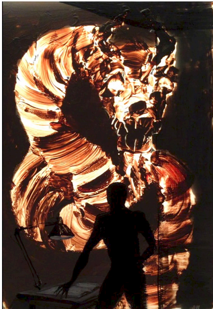
Peinture de recherche - apparition de créature