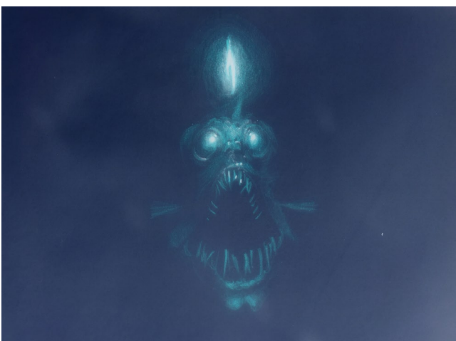
Poisson des abysses - Dessin animé