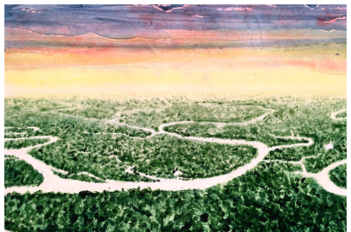
Amazonie- Décor déroulant peint