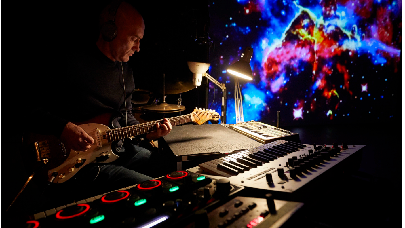
Extrait du spectacle STELLAIRE