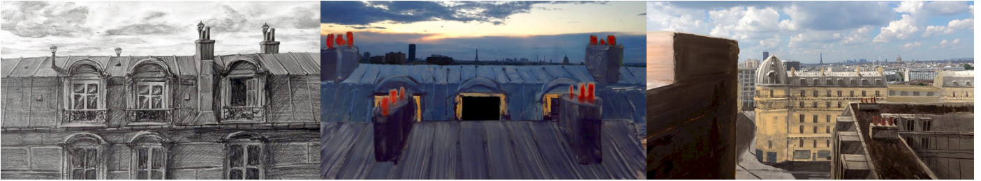
Dessin et Peintures de recherche - extérieur chambre