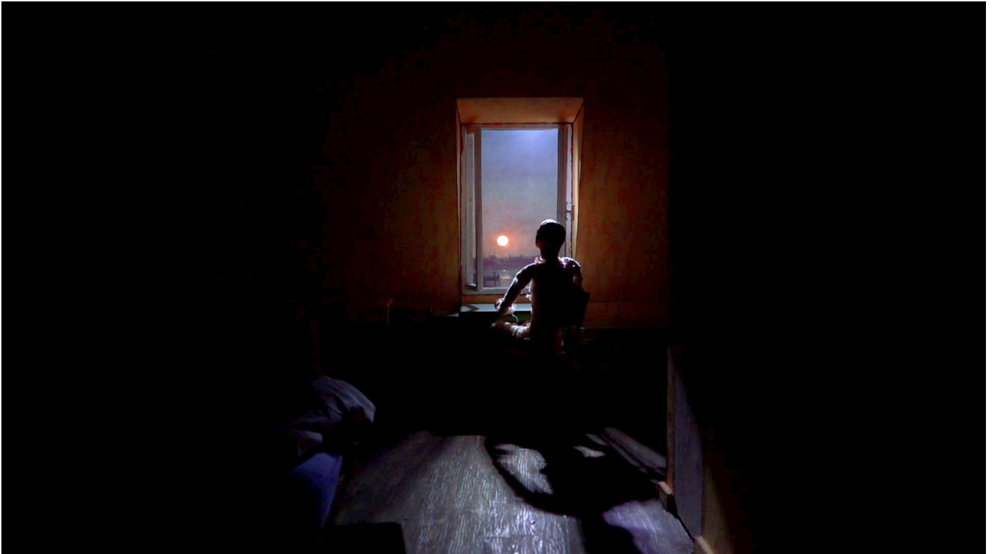
Intérieur chambre - Maquette

L'exposition vient compléter ces deux premières propositions, en montrant l'envers du décor, les étapes de recherche, les croquis préparatoires, le story-board ou encore des installations réalisées à partir de calques montrant les principes de l'animation en image par image ou comment créer un mouvement à partir de six ou sept dessins fixes.