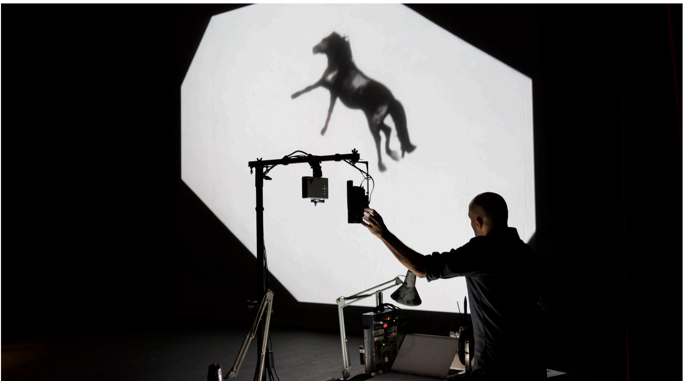
Extrait du spectacle DARK CIRCUS